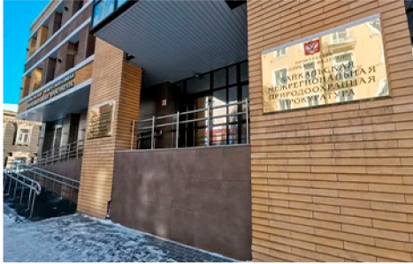
Байкальская межрегиональная природоохранная прокуратура