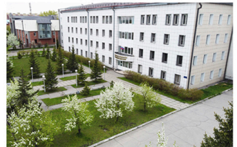
ФГКОУ ВО Иркутский юридический институт (филиал) «Университет прокуратуры Российской Федерации»

В 2014 году зародилась традиция проведения научно-представительского мероприятия, посвященного обсуждению природоохранных проблем, которое в 2023 году отметило свой 10-летний юбилей. 01-02 июня 2026 года проходит XIII Международный научно-практический форум "Байкальский экологический форум"