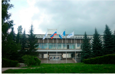
ФГБУН Институт географии им. В.Б. Сочавы Сибирского отделения Российской академии наук